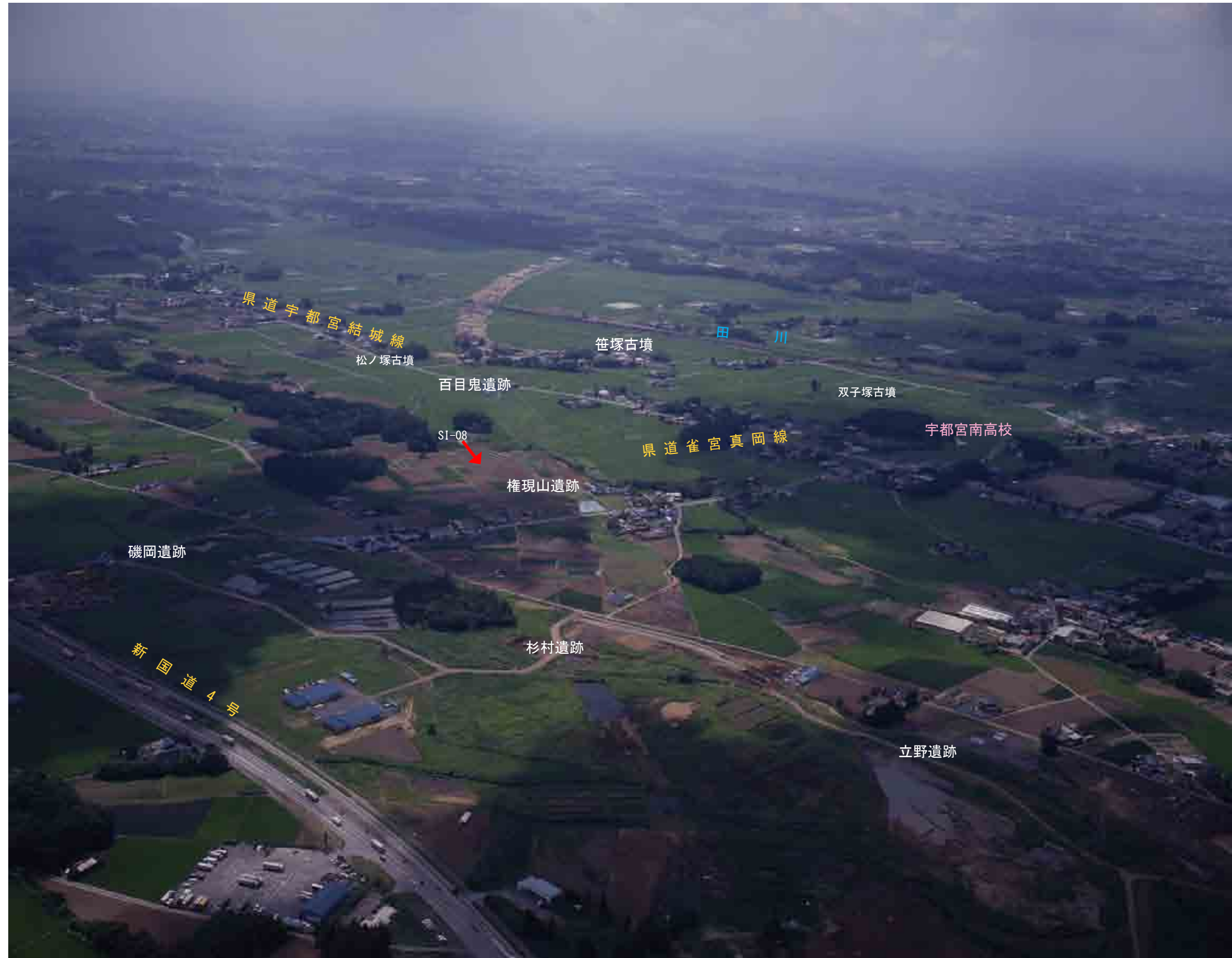
遺跡遠景(北東上空から、平成11年度撮影)