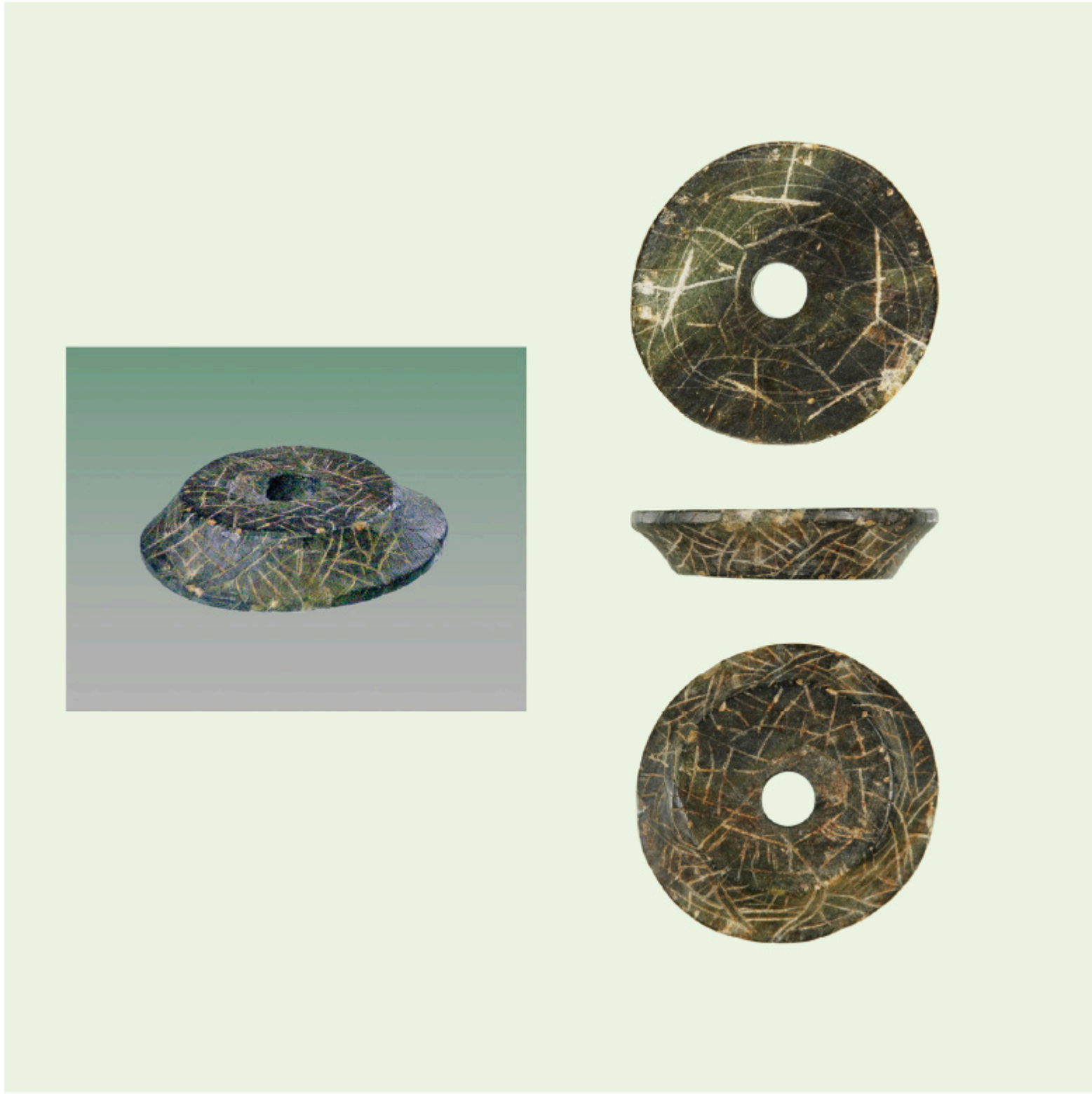
権現山遺跡調査 2 区 8 号住居跡出土 直弧文線刻紡錘車