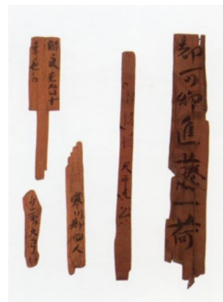
木簡（失敗したら削ります）