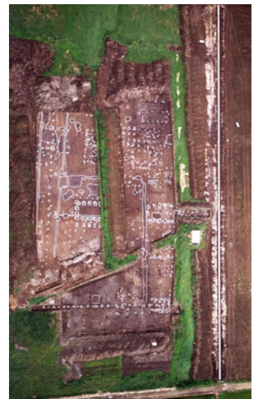
国司の館と推定される場所

現在下野国府跡は、栃木市教育委員会によって整備され、前殿の復元や、栃木市国府跡資料館が設置されるなど、史跡公園として活用されています。