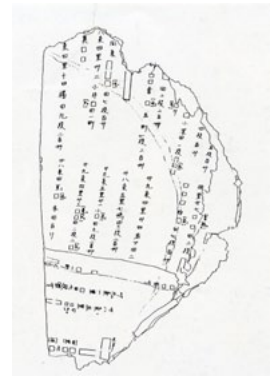
漆紙文書（土地台帳が記されています）