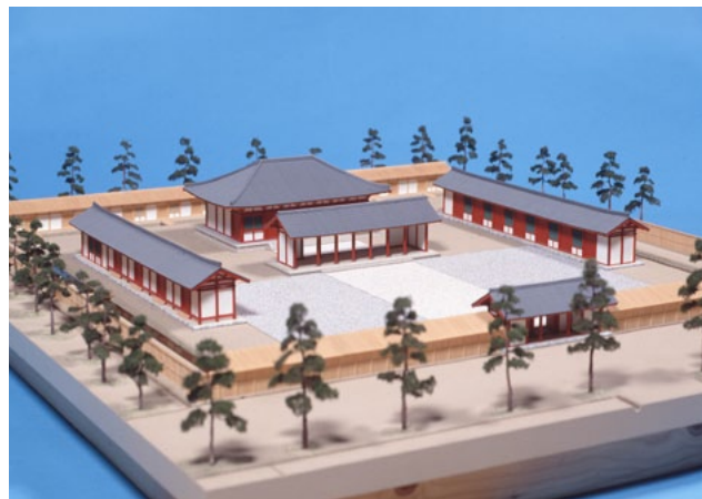
下野国府復元模型