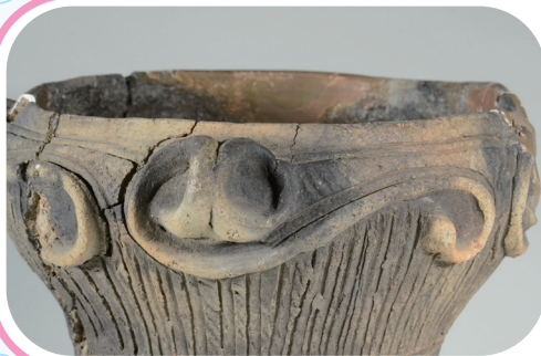
小突起の付く土器 みわなかまち 三輪仲町遺跡出土（那珂川町） 縄文時代中期 4800年ほど前

「S」字を倒したような文様がのびています。オタマジャクシ？ ヘビ？ 何に見える？