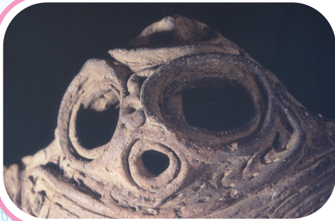
顔面突起の付く土器 じょうほうじ 浄法寺遺跡出土（那珂川町） 縄文時代中期 4800年ほど前