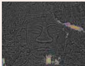
佐貫石仏 (塩谷町) (平安時代～現代)