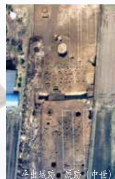
平出城跡 既跡(中世)