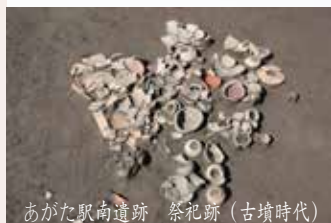
あがた駅南遺跡 祭祀跡(古墳時代)