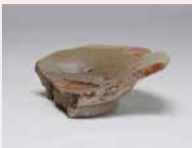
二条城跡 (栃木市) 青磁皿 (中世)