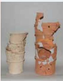
壬生愛宕塚古墳 (壬生町) 大きさの違う円筒埴輪