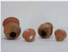
西高崎遺跡 (小山市) 穿孔された土師器 (古墳時代)