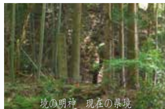
境の明神 現在の景境

あがた えきみなみ 駅南遺跡(足利市) 古墳時代の祭祀跡・平安時代の地震の痕跡 西高 にしだか 橋遺跡(小山市) 古墳時代前期の古墳・埴輪の胎土分析 四十八塚 しじゅうはちづか 古墳群(佐野市) 現地調査の最新情報 平出 ひらいでじょう 城跡(宇都宮市) 中世 宇都宮氏の支城の既跡 二条 にじょう 城跡(栃木市) 中世 城郭防御柵の痕跡を確認 境 さかい の明神遺跡(那須町) 近世 県境の小宿 佐貫石 さぬきせき 仏(塩谷町) 信仰遺跡の消長