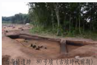
西高橋遺跡 80号墳(古墳時代前期)