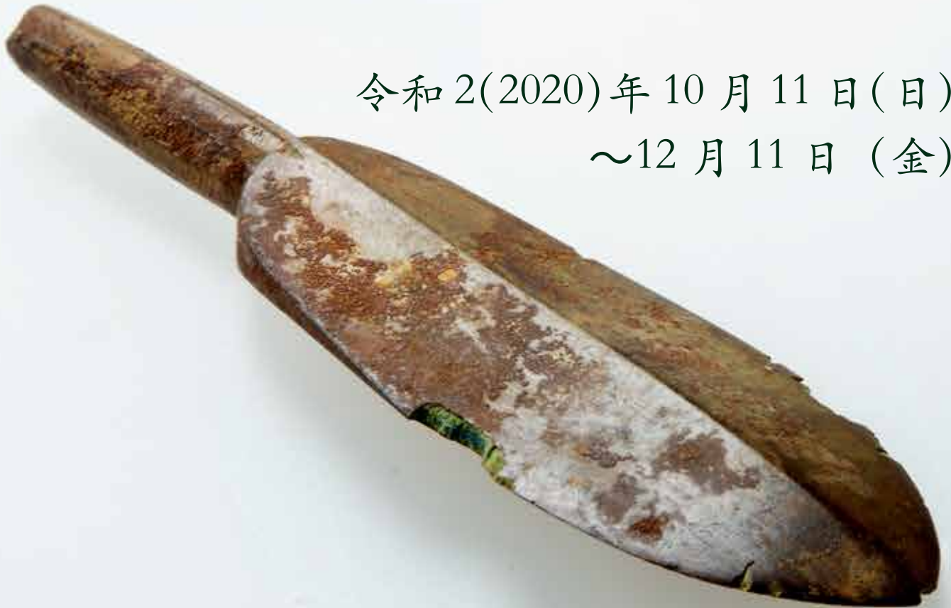
あがた駅南遺跡 銅鍔 (古墳時代) 実際の長さは全長59.3mm 撮影: 小川忠博 (表・裏面とも)