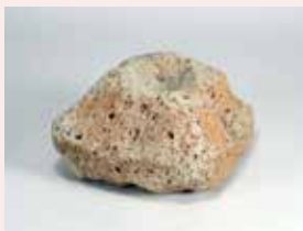
平出城跡 (宇都宮市) 大谷石製五輪塔火輪 (中世)

発掘調査報告会 10時から 特別講演会 13時30分から 詳しくは裏面をご覧ください