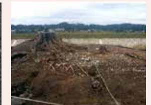
酒野谷原塚 (鹿沼市) ムラを守る水天宮 (近世～現代)