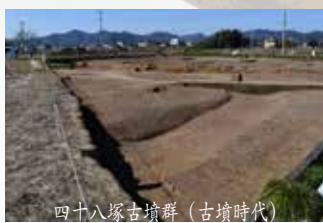
四十八塚古墳群(古墳時代)