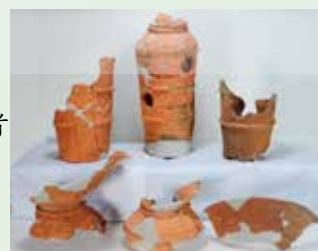
西高橋遺跡 91号埴輪形埴輪