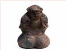
境の明神遺跡 (那須町) 土製大黒天 (近世)