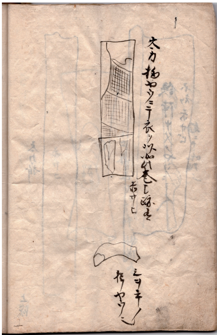
シオデの指のようである (不明鉄製品)